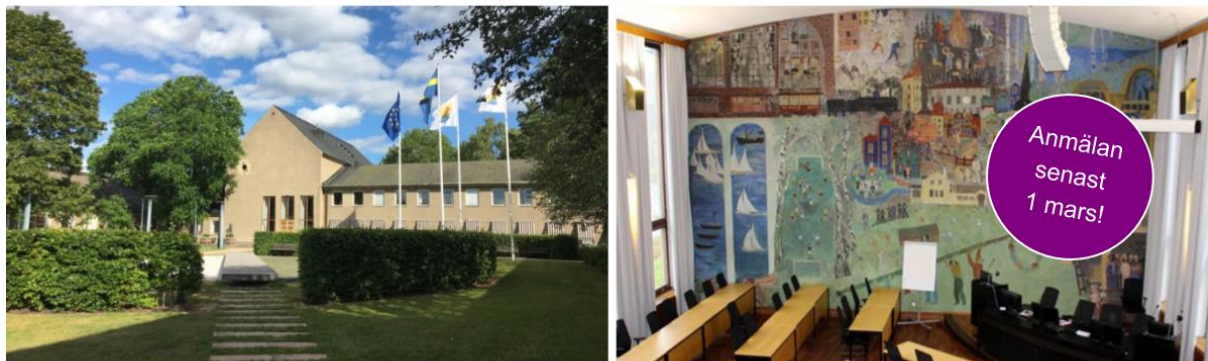
Huddinge kommunhus från 1948 är K-märkt och sessionssalen har en magnifik fresk signerad Sven X:et Erixson!